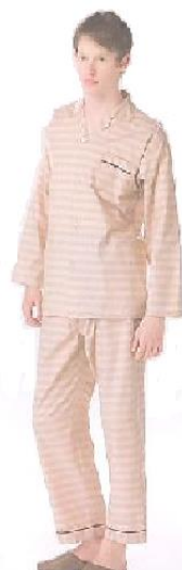
患者衣(上下タイプ) 男女兼用