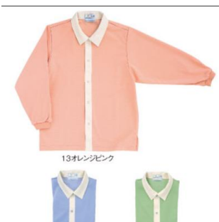
13オレンジピンク 室内着(上下タイプ) 男女兼用