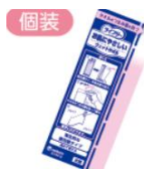
個装 個包装おしぼり