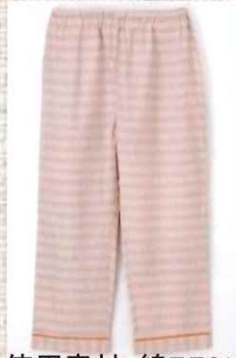
使用素材: 綿55% ポリエステル45%