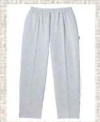
※室内着のみのレンタルはございません。