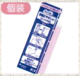
※画像はイメージです。 使用素材: 綿100%